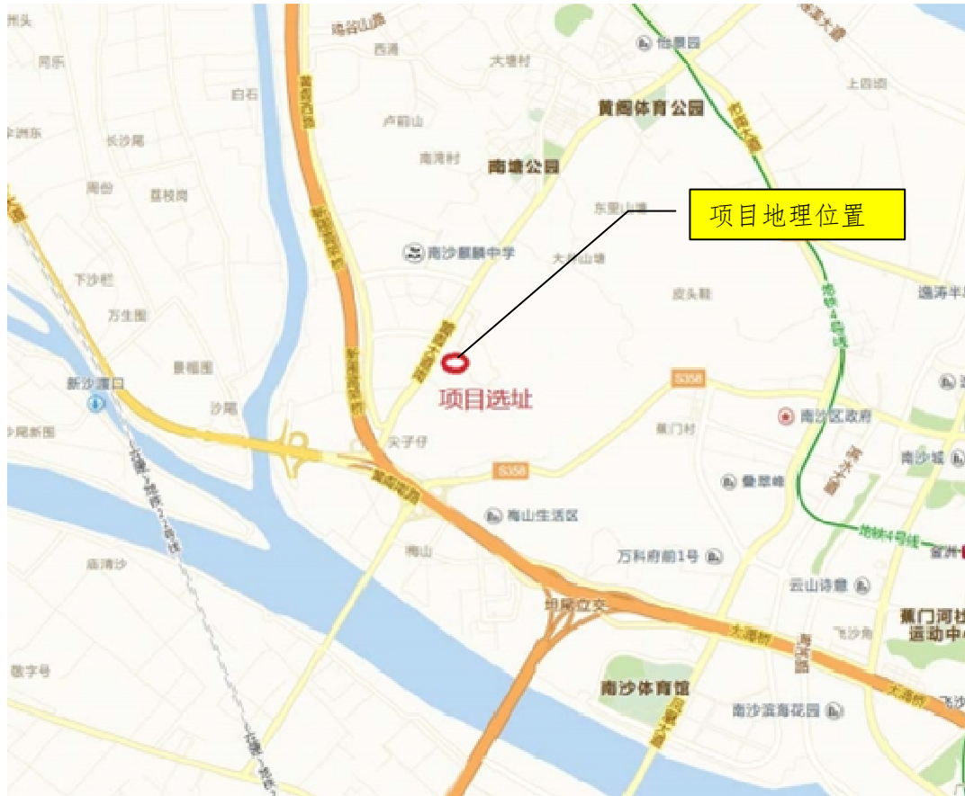
图 1-1 项目地理位置图

本项目位于广州市南沙区黄阁大道南段东侧，万科南方公园西南。项目的地理位置详见图 1-1。